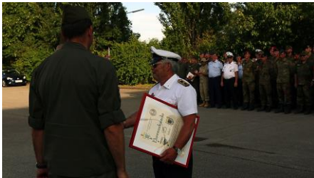
RK Marinestützpunkt BORKUM

Eine besondere Auszeichnung gab es auch für 25 und 15 jährige Teilnahme, sowie sehr gute kameradschaftliche Zusammenarbeit mit