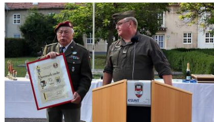
Verband der Tschechischen Reservisten

Anlässlich der Siegerehrung gab es einige Ehrungen verdienter UOG Mitglieder und Teilnehmer an den internationalen Wettkämpfen