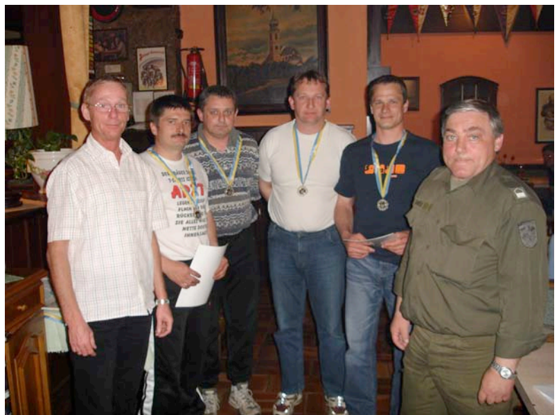
LANDESMEISTER 2006 Zweigverein MISTELBACH

Dementsprechend wurde dann dieser Sieg bis in den Morgenstunden gefeiert. Unter dem Motto: „Wir leben das Projektmanagement 2010“! So wurden in gemütlicher Runde einige neue Kameradschaften, in Hinblick 2010 geknüpft zwischen den Garnisonen MISTELBACH – GROSSENZERSDORF.