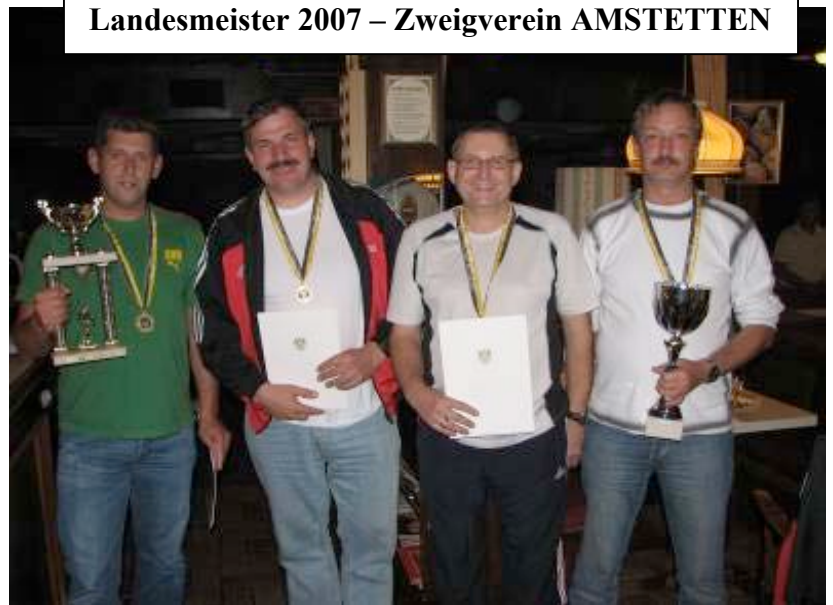
Landesmeister 2007 – Zweigverein AMSTETTEN

Dementsprechend wurde dann dieser Sieg bis in den Morgenstunden gefeiert.