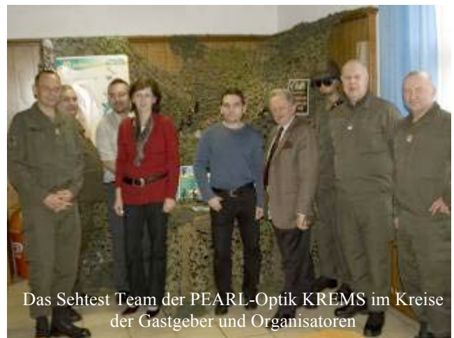
Das Sehtest Team der PEARL-Optik KREMS im Kreise der Gastgeber und Organisatoren

Das Angebot welches von über 100 Bediensteten wahrgenommen wurde fand bereits zum vierten Mal statt. Diese Untersuchung ersetzt zwar keine Gesundenuntersuchung beim Hausarzt, ist aber eine Momentaufnahme, bei der eventuelle Gefahrenquellen erkannt und somit frühzeitig medizinisch behandelt werden können. Einige Bedienstete vereinbarten direkt vor Ort einen Termin bei ihrem Augenarzt, als sie bemerkten